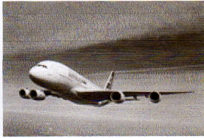
Env. 1 er jour pour 1 er jour du timbre P.A. A380 (Ces enveloppes seront numérotées avec texte approprié)