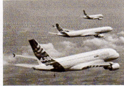
CP pour 1 er jour du timbre P.A. A380 avec A340 et A318