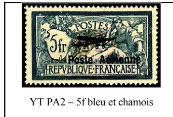
YT PA2 – 5f bleu et chamois