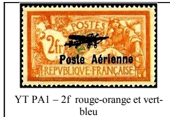
YT PA1 – 2f rouge-orange et vert-bleu

Ces feuilles ont fait l'objet d'un tirage spécial pour le 1er Salon de l'aviation, de la Navigation et de l'automobile du 25 Juin au 25 Juillet 1927 à Marseille. Ces deux timbres furent vendus au prix de 12 F avec le billet d'entrée à l'exposition (+5F). Sur les 95 000 paires imprimées, seules 60 000 furent vendues. 35 000 paires furent incinérées (!) en Août 1927.